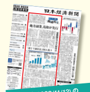
日報新聞(2022/11/12)の一面でも取り上げられました!